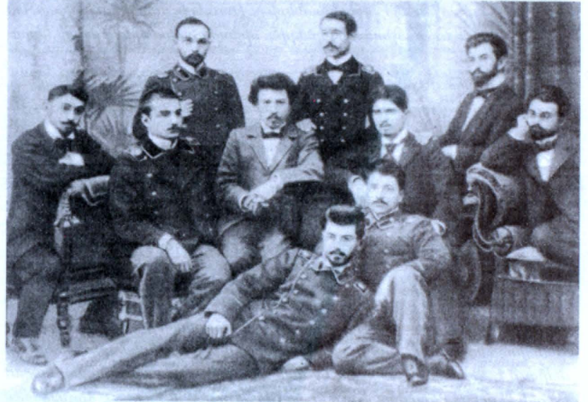
«Թեորետիկ» խմբակի անդամները.

Խմբակը, որն ուներ 10 անդամ, իր առջև նպատակ էր դրել ուսումնասիրել տարբեր երկրների հեղափոխական շարժումների տեսական հիմունքները: