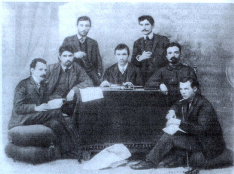
«Бакинский рабочий» քերթի խմբագրությունը (1907-1908թ.թ.)