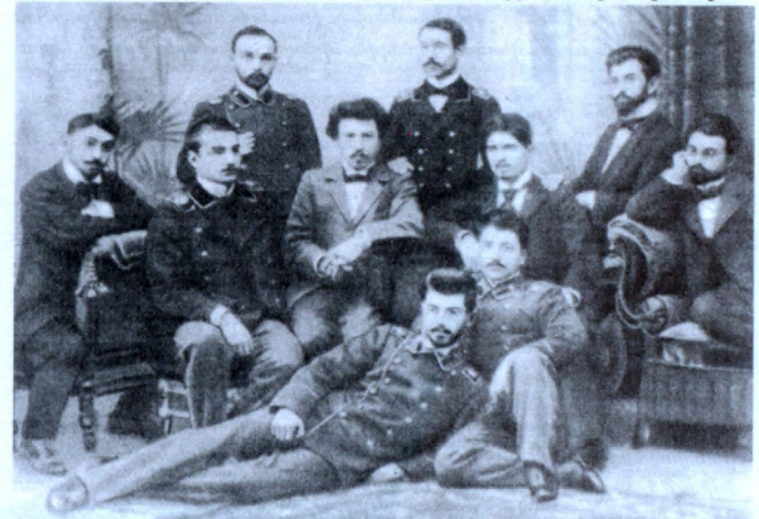
«Թեորետիկ» խմբակի անդամները.

Խմբակը, որն ուներ 10 անդամ, իր առջև նպատակ էր դրել ուսումնասիրել տարբեր երկրների հեղափոխական շարժումների տեսական հիմունքները: