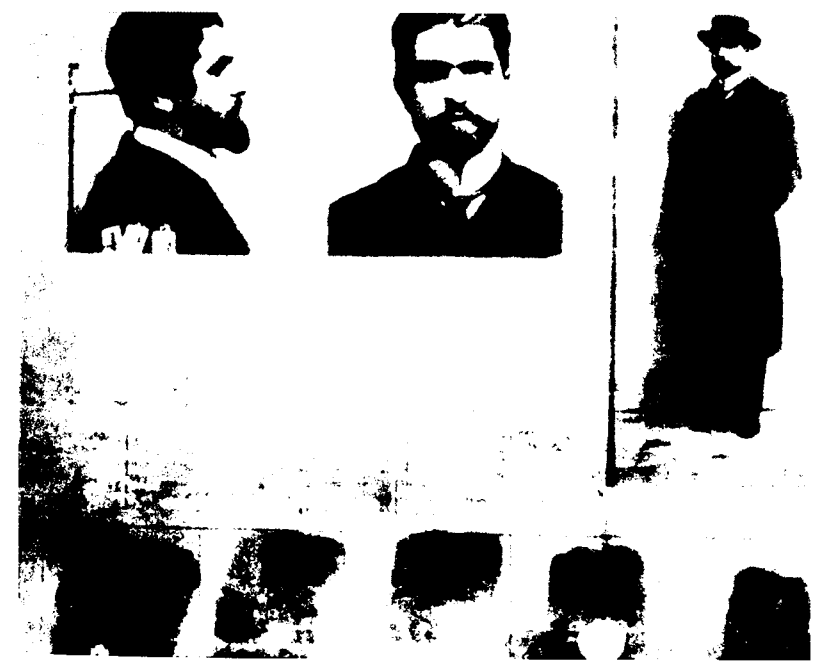
Ստ. Շահումյանի ձերբակալված ժամանակի լուսանկարները (Բաքու, 1911թ.)

2. Ազգանուն, անուն, հայրանուն (ամուսնացածների դեպքում նշել սկզբնական ազգանունը), իսկ եթե հրեա է, ապա ինչպես է կոչվում քրիստոնեական անունով-Շահումյան Ստեփան Գևորգի։