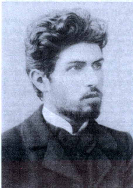
Ստ. Շահումյանը 1902 թ.

Իր սովորության համաձայն Շահումյանը չէր բավարարվում ուսանող ընթացքում ձեռք բերված գիտելիքներով: Նա մեթոդիկ կերպով