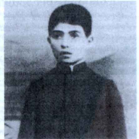
Ստ.Շահումյանը Թիֆլիսի ռեալական ուսումնարանի աշակերտ

Շահումյանի ծնողները համաձայնում են և արդյունքում Ստեփան Շահումյանը 1889 թ. ընդունվում է Թիֆլիսի ռեալական ուսումնարանի նախապատրաստական դասարան, չարունակելով պարտապես ինտարովի տղայի հետ: