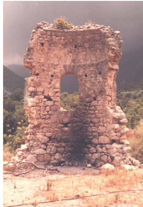
Նկար 2. Ս. Սարգիս եկեղեցոյ արեւելեան կիսաշրջանաձեւ պատը՝ ներսէն դիտուած: Այժմ՝ ամբողջապէս քանդուած