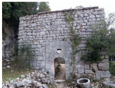
Նկար 8. Արամո գիւղի մօտիկ Ս. Աստուածածնայ վանքի Ս. Գեորգ եկեղեցին, մասնակի վերանորոգութեան ենթարկուած է 1903-ին