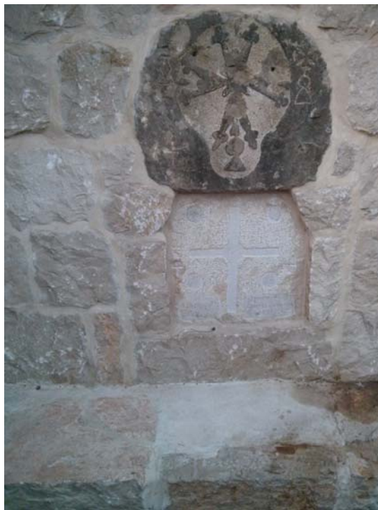
Նկար 6. Ներքի գիւղի 2017-ին վերանորոգուած աղբիւրը: Խաչքարը Մարտ 2018-ին գիւղ ներխուժած ծայրահեղ իսլամիստներու գնդակներուն թիրախ դարձած էր