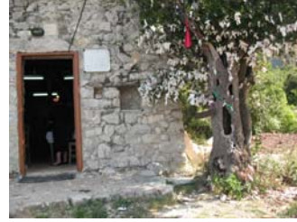
Նկար 20. Ս. Ստեփանոսի դրան առջև սրբացուած դափնին