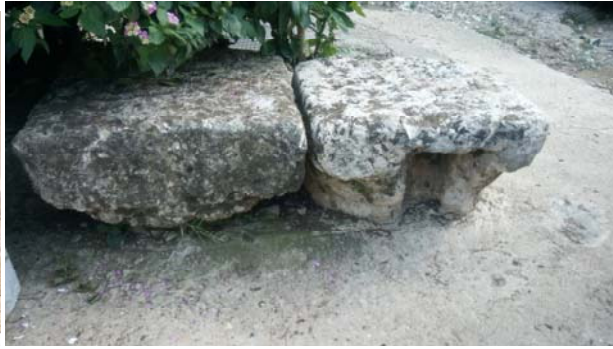
Նկար 4. Ս. Գեորգի շրջակայքէն գտնուուած սիւնի խարխախ եւ խոյակ