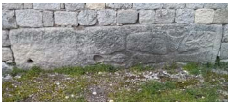
Նկար 7. Արամո գիւղի 1907-ին վերակառուցուած Ս. Ստեփանոս եկեղեցոյ հարաւային պատին ագուցուած նախկին կառոյցի խաչքարերէն մէկը