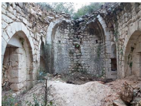
Նկար 9. Արամո գիւղի մօտիկ Ս. Աստուածածնայ վանքի Ս. Գեորգ եկեղեցոյ ներքնամասը: Գանձախոյզներ բոլորովին վերջերս քանդած են խորանին սեղանը ու բացած երկու մարդահասակ խորութեամբ փոս մը