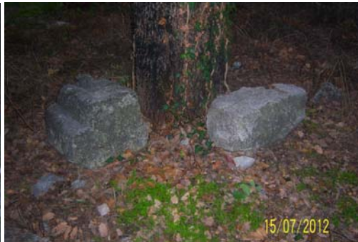
Նկար 17. Ներքի գիւղի կիղիցիկէն մնացած երկու սրբատաշ քար՝ սրբազան կաղնիին տակ