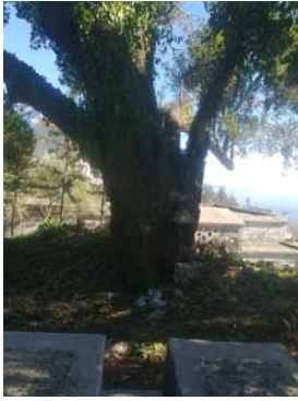
Նկար 18. Քեօրքիւնէի Ս. Ստեփանոսը. հաստաբետտ կաղնիի բունին կ'երեւին խորանի քանի մը քարերը