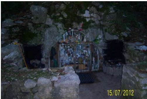
Նկար 16. Ս. Մարութի ընդհանուր տեսքը՝ վերջերս ցանցապատուած կեդրոնի խորանով