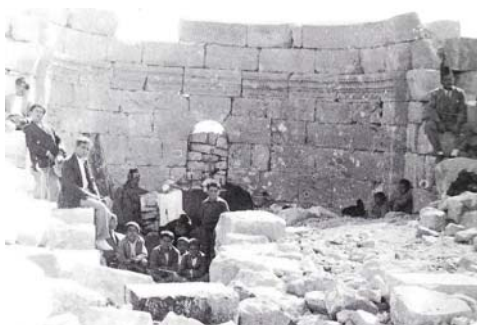
Նկար 10. Քեսապցի ուխտաւորներ Պալլումի ուխտավայրին մէջ, 1939-ն առաջ