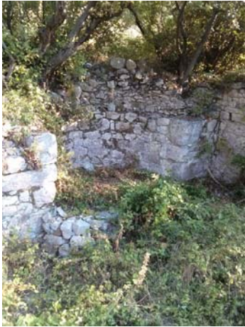
Նկար 13. Գարատուրանի ծովամերձ Ս. Գեորգի արեւելեան պատի խորշը՝ խորանը