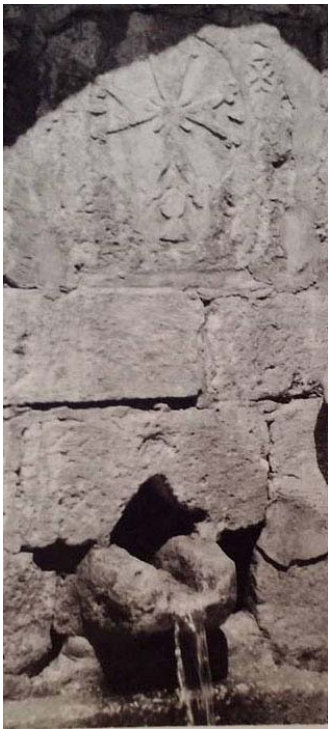
Նկար 5. Ներքի գիւղի աղբիւրը՝ քովի կիղիցիկէն հոն տեղադրուած խաչքարով