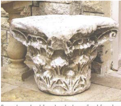
Նկար 3. Քեօքքինէի Ս. Ստեփանոս կիղիցիկի մօտեկայքէն գիւղի Աւետ, եկեղեցի փոխադրուած խոյակ