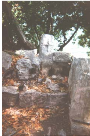
Նկար 14. Գալեմտերեան-Մանճիկեան թաղի կիղիցիկի հարաւային պատէն անկիւն մը եւ խաչքարը