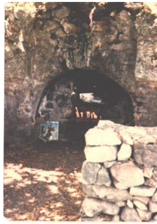
Նկար 15. Ս. Մարութի կեդրոնական խորանը