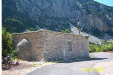
Նկար 19. Գարատուրանի Ծովու թաղի Ս. Ստեփանոսը