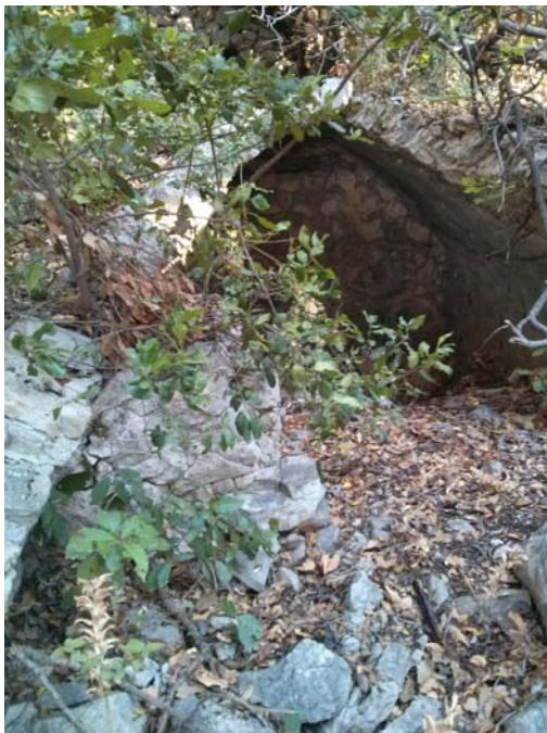
Նկար 1. Ս. Գեորգի կողքին գտնուող քարէ կամարապատ ծածկով կիսաքանդ շէնքը

Ֆրանսահայ Երկիր եւ Մշակոյթ Միութիւնը վերանորոգեց ծածկը, պատուհաններն ու դուռը, ամրացուց պատերը: Կայ արձանագրութիւն. Ս. Ստեփանոս Եկեղեցի Հայոց, նորոգեցաւ յամի տեսոն 1987, արդեամբ հայ ժողովրդեան : Անկէ ետք տարին մէկ անգամ հոս պատարագ կը մատուցուի եւ լուռ օրերուն հայ եւ օտար, քրիստոնէայ եւ այլազգի մեծ թիւով այցելութիւններ կ'ունենայ: Յատկապէս զաւակ ունենալու խնդրանքով կիներ կը դիմեն անոր օգնութեան: Կը հաւատան անոր զօրութեան: Կը գտնուի Գարատուրանի Ս. Աստուածածին եկեղեցոյ թաղականութեան խնամքին տակ: