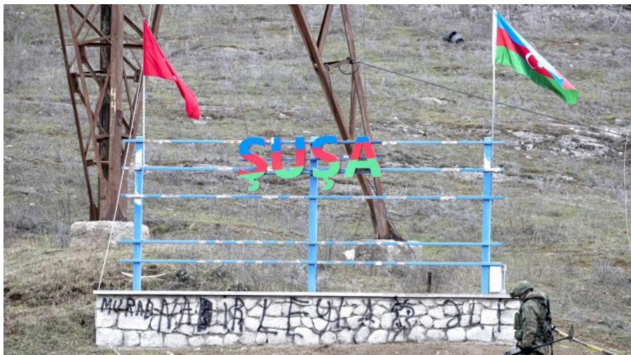
Der Ortseingang der Stadt Schuscha wird im November 2020 von russischen Soldaten bewacht.

der Armenier vor dem, was auf die Übergabe der Provinz folgt, von dem, was die Aserbaidschaner hier Anfang der 1990er-Jahre erleben mussten? Und was ist das bloß für ein Konflikt, in dem beide Seiten einander nicht nur Land und damit einen Platz in der Gegenwart absprechen – sondern gleich die gesamte Geschichte und damit auch die Vergangenheit?