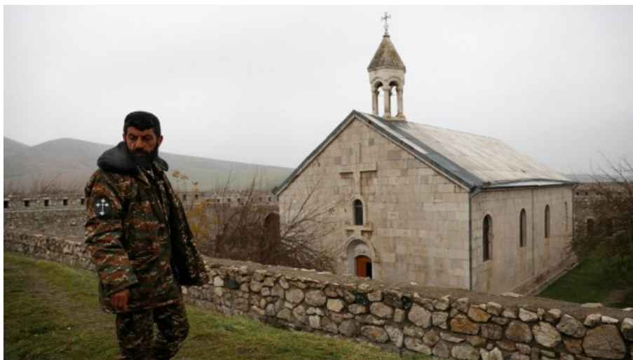
Das Klosters Amara im Dezember 2020: „Die armenischen Kirchen sind wichtig für unseren Glauben.“

„Ich möchte nicht über den Krieg sprechen. Jeder Krieg ist schlimm und dieser Krieg war schlimm für uns.“