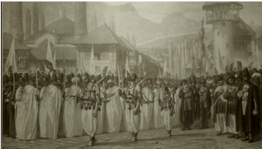
Muslimische Muharram-Prozession in Schuscha. Grafik um 1865 von Wassili W. Werestschagin, Moskau, Staatliche Tretjakow-Galerie.

Eine Vergangenheit, die im Kaukasus ohnehin komplex ist. Eingefasst zwischen dem Schwarzen Meer im Westen und dem Kaspischen Meer im Osten ist der Kaukasus eine Nahtstelle von Europa und Asien – und Hinterhof der großen Imperien. Heute wird die Region dominiert von Russland im Norden, der Türkei im Westen und Iran im Süden. Gleichsam den Erben der Sowjetunion, des Osmanischen Reichs und Persiens. Die vielfältigen Einflüsse dieser Großreiche und ihr Ringen um die Vorherrschaft machen den Kaukasus seit jeher zu einem ethnischen Flickenteppich.