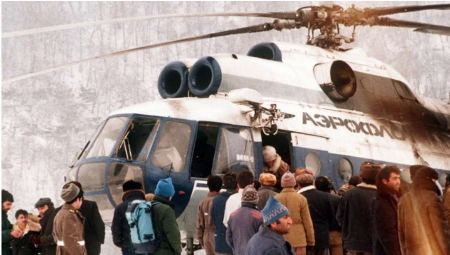
Am 3. März 1992 wurden armenische Flüchtlinge aus Stepanakert, die Hauptstadt von Berg-Karabach, evakuiert.

gelegen, waren eingerüstet und wurden renoviert. Weniger Wochen nach unserem Besuch dort wird die Moschee unter Protest Aserbaidschans als Beispiel persischer Baukunst der Welt präsentiert.