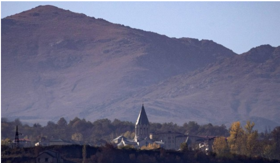
Bergkarabach im Oktober 2020: Blick auf die Stadt Schuscha, die sowohl für Armenier als auch Aserbaidschaner wichtig ist.

Von Florian Guckelsberger und Manuel Daubenberger