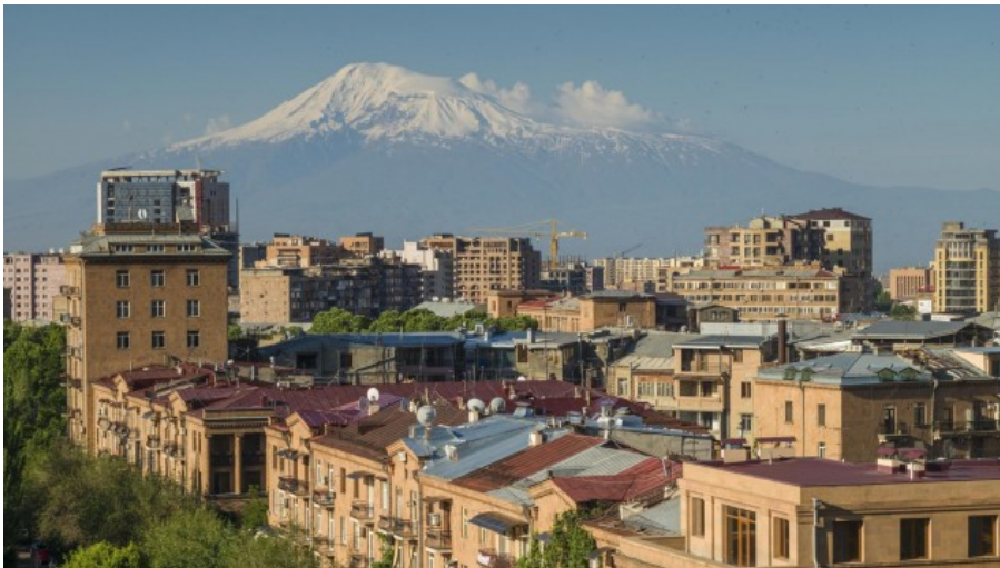
Blick auf den Ararat von der armenischen Hauptstadt Jerewan im Januar 2021.

Nach unserem Besuch in Amaras wollen wir verstehen, welche Rolle Kirchen und Moscheen im Konflikt zwischen dem christlichen Armenien und dem muslimischen Aserbaidschan spielen. Wir recherchieren weiter und hören von einem wichtigen Ort, der sich in einem unscheinbaren Hinterhof im Süden der armenischen Hauptstadt Jerewan befinden soll. Dort werden wir lernen, mit Religion hat der Streit um die Gotteshäuser nur am Rande zu tun.