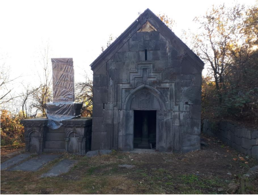
Նկար 2. Սուրբ Հարություն մատուռի տեսքը արևմուտքից

Պեղումների հիմնական արդյունքները. Սուրբ Հակոբ եկեղեցում պեղումները տվեցին զգալի արդյունքներ թե՛ ճարտարապետության և թե՛ շերտագրության տեսանկյունից: Դրանց ընթացքում բացվեցին եկեղեցու գետնախարիսխը, հիմքերը, կավահողային հատակը: