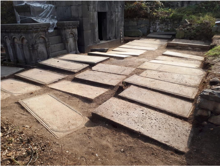
Նկար 4. Մուրբ Հարություն եկեղեցուց և Գրիգոր Տուտեորդու խաչքարից արևմուտք բացված սալատապանները (ընդհանուր տեսարան հյուսիս-արևմուտքից)