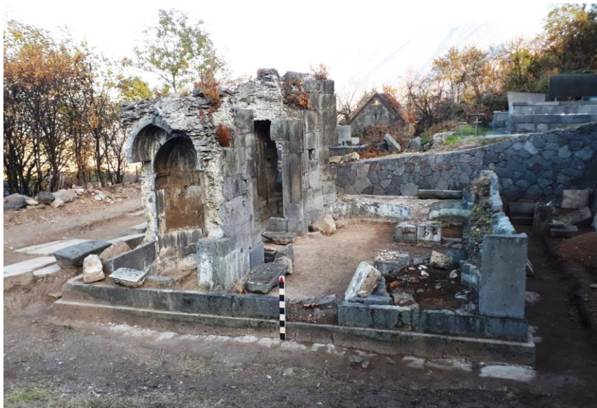
Նկար 1. Սուրբ Հակոբ եկեղեցու տեսքը պեղումների ավարտին

Վերջին անգամ Սուրբ Հակոբ եկեղեցուն անդրադարձ է կատարվել 2012 թ.՝ Լոռու մարզին նվիրված «Դիվան Հայ վիմագրության» պրակում, որտեղ մասնավորապես գրված է. «Այս եկեղեցին, որի պատերի ստորին շարքերն ու բեկորները բացվել են 15 տարի առաջ, քանդվել է 18-րդ դ. 90-ական թվականներին և կարոտ է լուրջ ուսումնասիրության» 3 : Նույն աշխատության մեջ ևս մի կարևոր դիտարկում է արված այն մասին, որ Մեծ գավթի հյուսիսային պատի նորոգումները ևս արվել են Սուրբ Հակոբ եկեղեցու քարերով 4 :