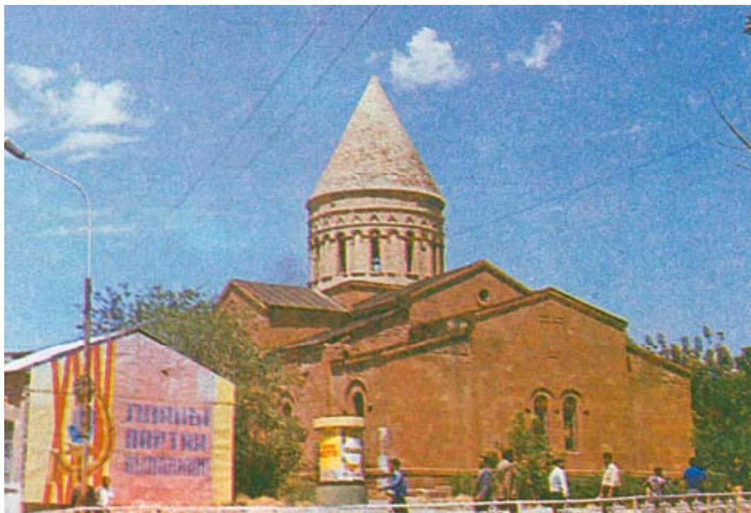
Церковь Сурб Геворг, построенная в 1869-м году. на фундаменте более ранней армянской церкви в г. Нахичевань. Снимок сделан во второй половине 1970-х годах.