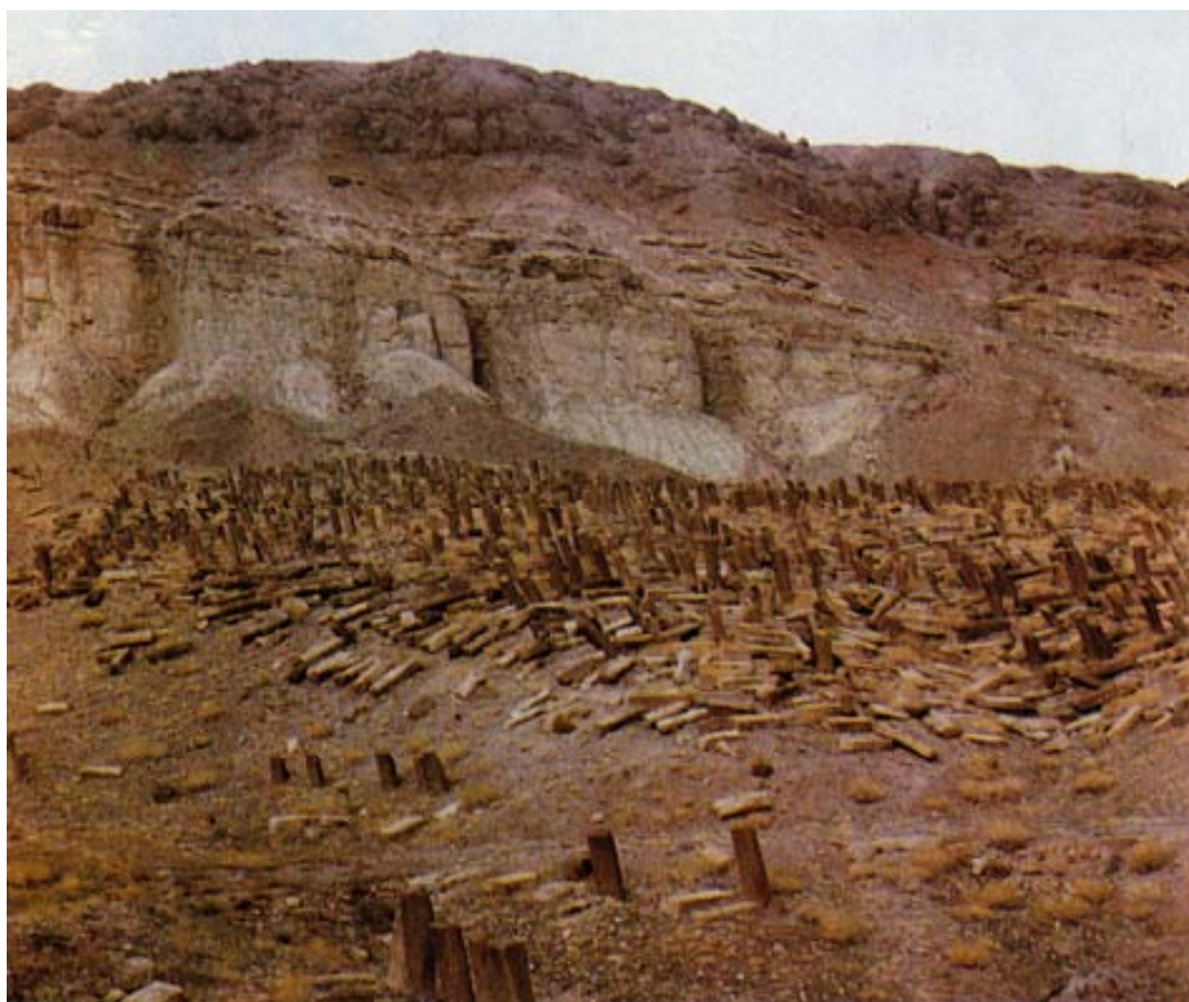
Хачкары армянского кладбища Старой Джуги в Нахичеванском крае. Видно, насколько несчётно их количество, а также то, что местные власти не ценят эти произведения средневекового искусства. Снимок сделан во второй половине 1970-х гг.