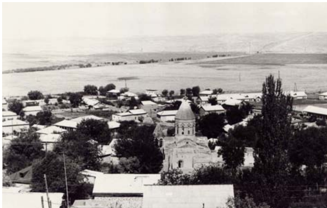
Бывшее армянское село Айлапат, расположенное рядом с г. Нахичевань. В центре армянская церковь. За селом видна дорога на Ереван. С правой стороны от дороги практически пустынное пространство, которое в советское время (и может быть и сейчас) использовалось в качестве ездового и стрельбового полигона нахичеванского танкового полка. Снимок сделан в 1970-ых годах.