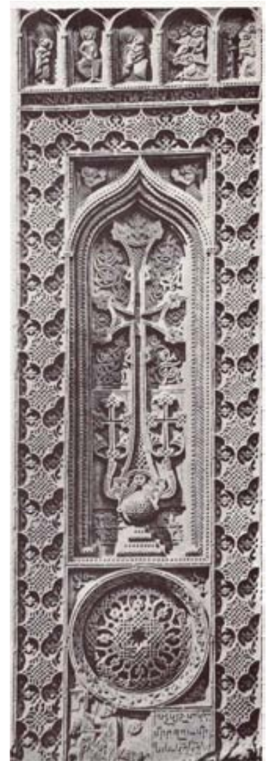
Один из тысяч джугинских хачкаров (1601г.), уничтоженных в 1990-х – 2000-х гг.

Фотография приведена из книги Аргам Айвазяна “Мемориальные памятники и рельефы Нахиджевана” г. Ереван, “Айастан” 1987г. (на армянском языке, стр 273 и на четвёртой странице обложки)