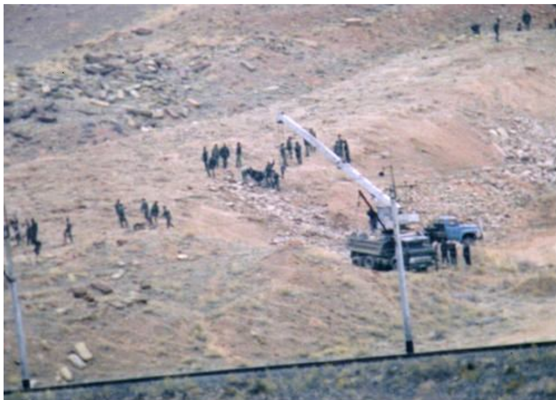
Уничтожение азербайджанскими солдатами хачкаров армянского кладбища Старой Джуги в Нахичеванском крае. Кадр из видео-съёмки, сделанной 20-го января 2005 года. с иранского берега реки Аракс.

Видеозапись уничтожения азербайджан- скими солда- тами хачкаров армянского кладбища Старой Джуги в Нахичеван- ском крае можно просмотреть здесь: http://www.youtu be.com/watch?v= yhhQ0z87oiY .