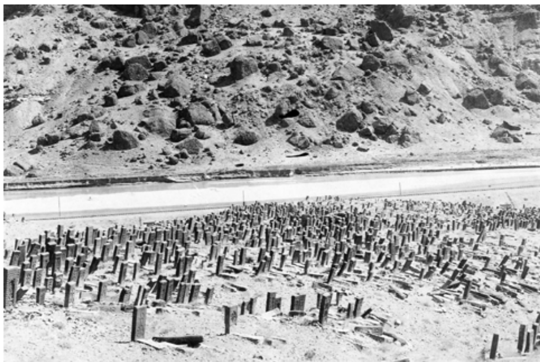
Хачкары армянского кладбища Старой Джуги в Нахичеванском крае. Кроме хачкаров видны: река Аракс, параллельное ей железнодорожное полотно и противоположный – иранский берег реки. Снимок сделан во второй половине 1970-х гг.